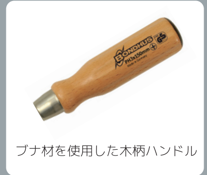
ブナ材を使用した木柄ハンドル