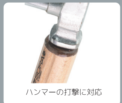
ハンマーの打撃に対応