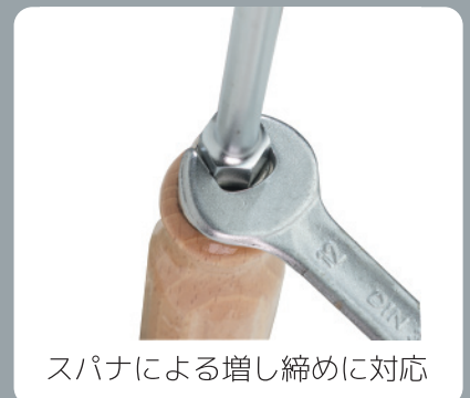
スパナによる増し締めに対応